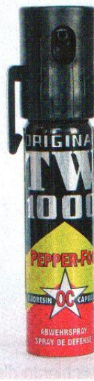
↑ Oltre alle armi, banditi "gli strumenti atti a offendere e qualunque altro mezzo di coazione fisica". Quindi niente spray al capsicum e niente manette.

o il gestore, che non ha il proprio personale iscritto nell'apposito registro prefettizio, incorrano nella sola sanzione amministrativa. Gli altri soggetti che svolgono tali compiti in mancanza dell'apposita autorizzazione prevista potrebbero incorrere anche nel reato di esercizio abusivo della professione. Va inoltre evidenziato che questi servizi non hanno nulla a che fare con l'attività di "portierato", disciplinato in modo differente.