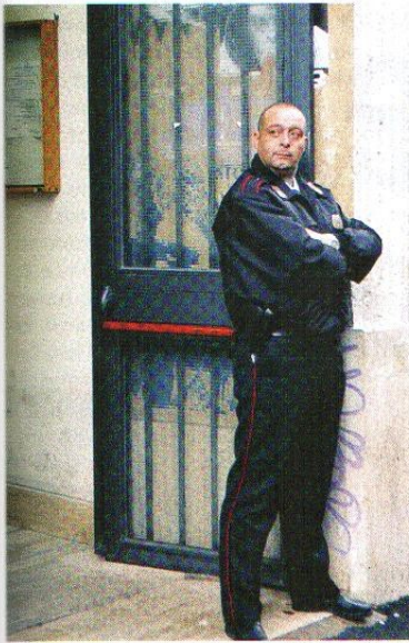
↑ Le normali guardie giurate potranno svolgere il lavoro di "buttafuori", ma dovranno essere disarmate.

registro prefettizio, con domanda di iscrizione indirizzata al prefetto competente per territorio. Sono obbligatori alcuni requisiti: età non inferiore a 18 anni, buona salute fisica e mentale, assenza di daltonismo, assenza di uso di alcool e stupefacenti, capacità di espressione visiva, di udito e di olfatto, assenza di elementi psicopatologici, anche pregressi, attestati da certificazione medica delle autorità sanitarie pubbliche. Indispensabile non essere stati condannati (anche con sentenza non definitiva) per delitti non colposi, non essere sottoposti né essere stati sottoposti a misure di prevenzione, ovvero destinatari di provvedimenti di cui all'articolo 6 della legge 13 dicembre 1989, n° 401; non essere aderenti o essere stati aderenti a movimenti, associazioni o gruppi organizzati di cui al decreto legge 26 aprile 1993, n° 122, convertito dalla legge 25 giugno 1993, n° 205. Sotto il profilo culturale, occorre almeno il diploma di scuola media inferiore e il superamento del corso di formazione di cui all'articolo 3.